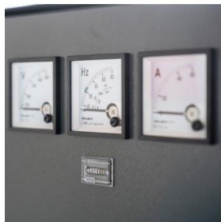
Überwachungsanzeigen & Stundenzähler