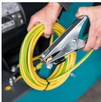
Erdungskabel mit Klemmzange