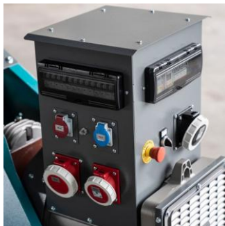
Stromverteiler mit Haus & Feldseite

Zapfwellengeneratoren gibt es von 20 - 130 kVA und können so spezifisch anhand Ihrer Anforderungen ausgewählt werden